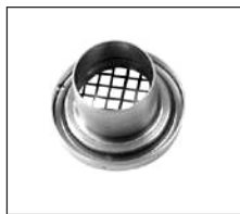
Figura 3. Cassette de acero inoxidable

Todas las modalidades de cassette pueden incorporar un clip (ver Figura 4) que protege el conjunto de la unidad -cassette+filtro-, durante el transporte y almacenamiento, una vez extraída de la cabeza o cuerpo del IOM.