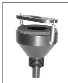
Figura 6. Adaptador IOM

En la captación las partículas se depositan en el interior del cassette provisto de un filtro de 25 mm, cuya naturaleza puede variar (fibra de vidrio, PVC, etc.) en función del