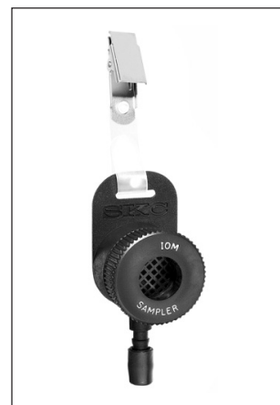
Figura 1. Muestreador IOM de plástico

Los cassettes de plástico y metálicos se presentan en las Figuras 2 y 3.