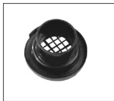
Figura 2. Cassette de plástico