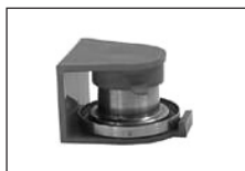
Figura 4. Clip de transporte

La diferencia de pesada, entre antes y después de la captación, del conjunto cassette-filtro-espuma corresponde a la fracción inhalable y la del conjunto cassette-filtro (sin el disco de espuma) a la fracción respirable (4) (7) (21).