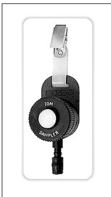
Figura 5. Muestreador IOM multifracción