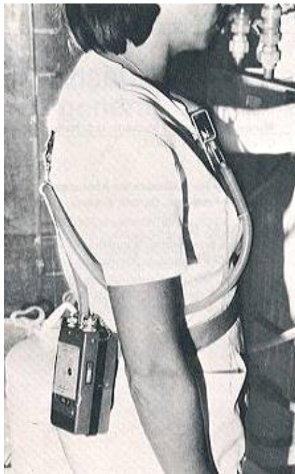
Fig. 2: Individuo portando sistema completo de captación

Durante el muestreo se vigilará el caudal y en caso de producirse cualquier variación del mismo se procurará corregirla de modo que se mantenga el valor previamente establecido. De no ser ello posible se anulará la muestra. La duración del muestreo no deberá superar las cuatro horas, tras las cuales será preciso volver a cargar las baterías de las bombas.